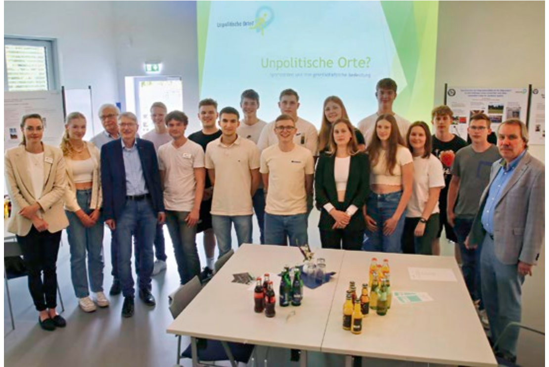
Unter dem Titel „Unpolitische Orte? Sport und seine Geschichte(n) am Gymnasium Lobne“ wurde im großen Vortragssaal des Lohner Industriemuseums eine neue Sonderausstellung eröffnet.

Dank an die Schülerschaft und alle, die am Projekt beteiligt waren, erklärte Dr. Michael Brandt, der Geschäftsführer der Oldenburgischen Landschaft, die Ausstellung für eröffnet. Schülerinnen und Schüler standen dann noch zur Erläuterung ihrer Poster zu intensiven Gesprächen bereit.