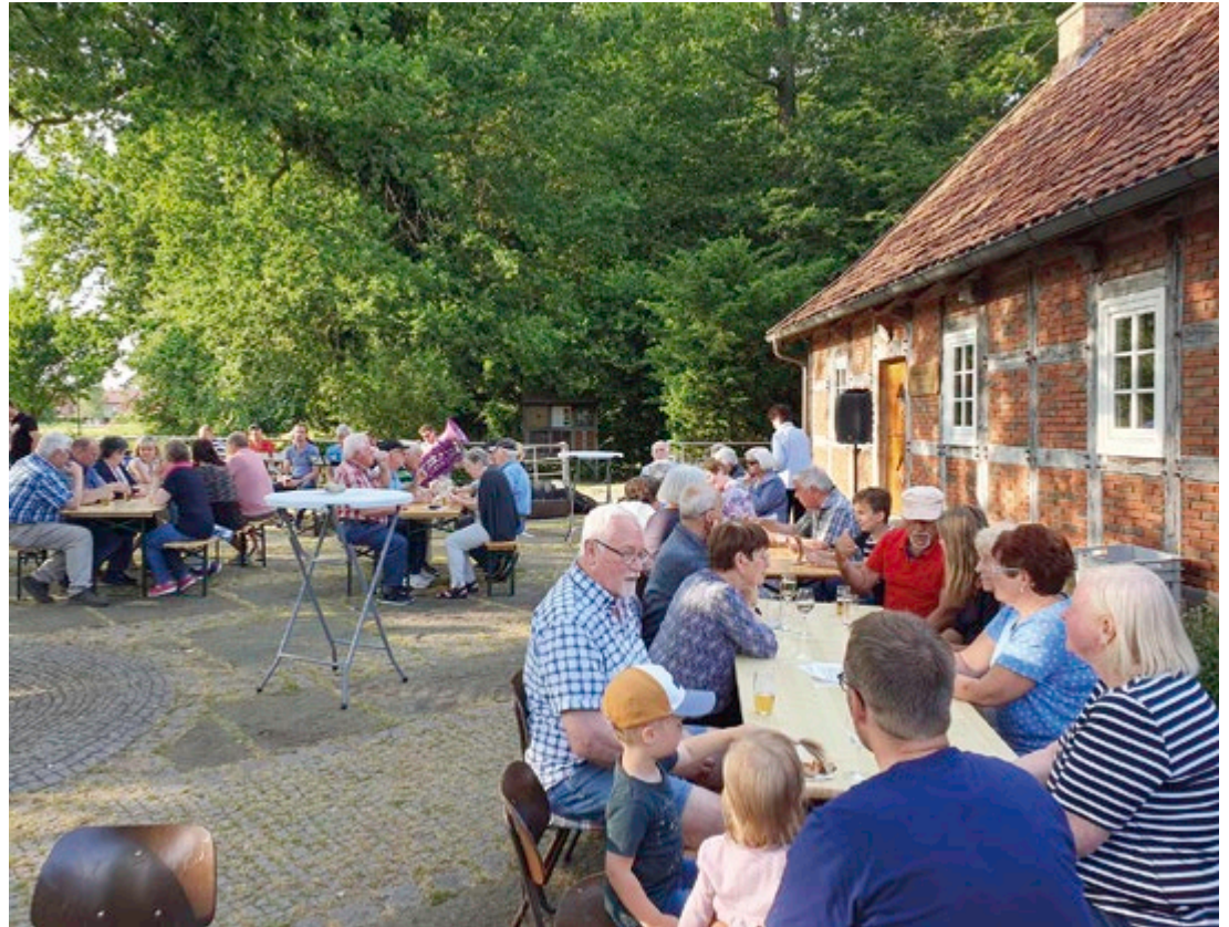
Am Heimathaus Feldmühle lud der Heimatverein Bersenbrück anlässlich des 70jährigen Jubiläums zu einem musikalischen Dämmerstopp ein.