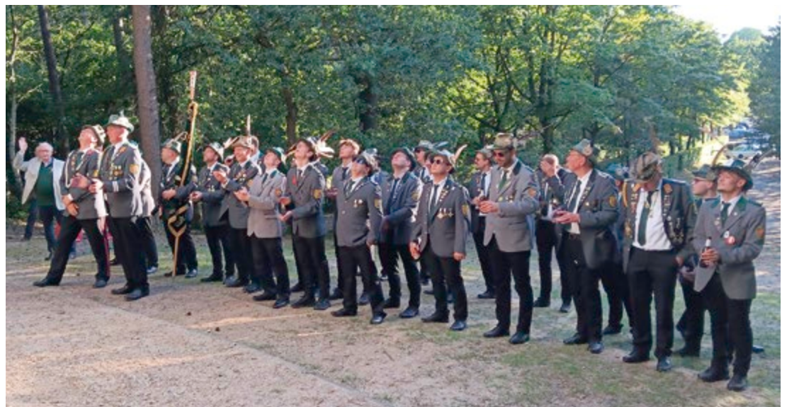
Vor dem Aussichtsturm in Lohne fand das traditionelle Aufnahme-ritual der Schützen der 58. Kompanie „Die Türmer“ in den Heimatverein Lohne e.V. statt.

Eine sehr gelungene Veranstaltung, die im nächsten Jahr eine Neuauflage erhält.