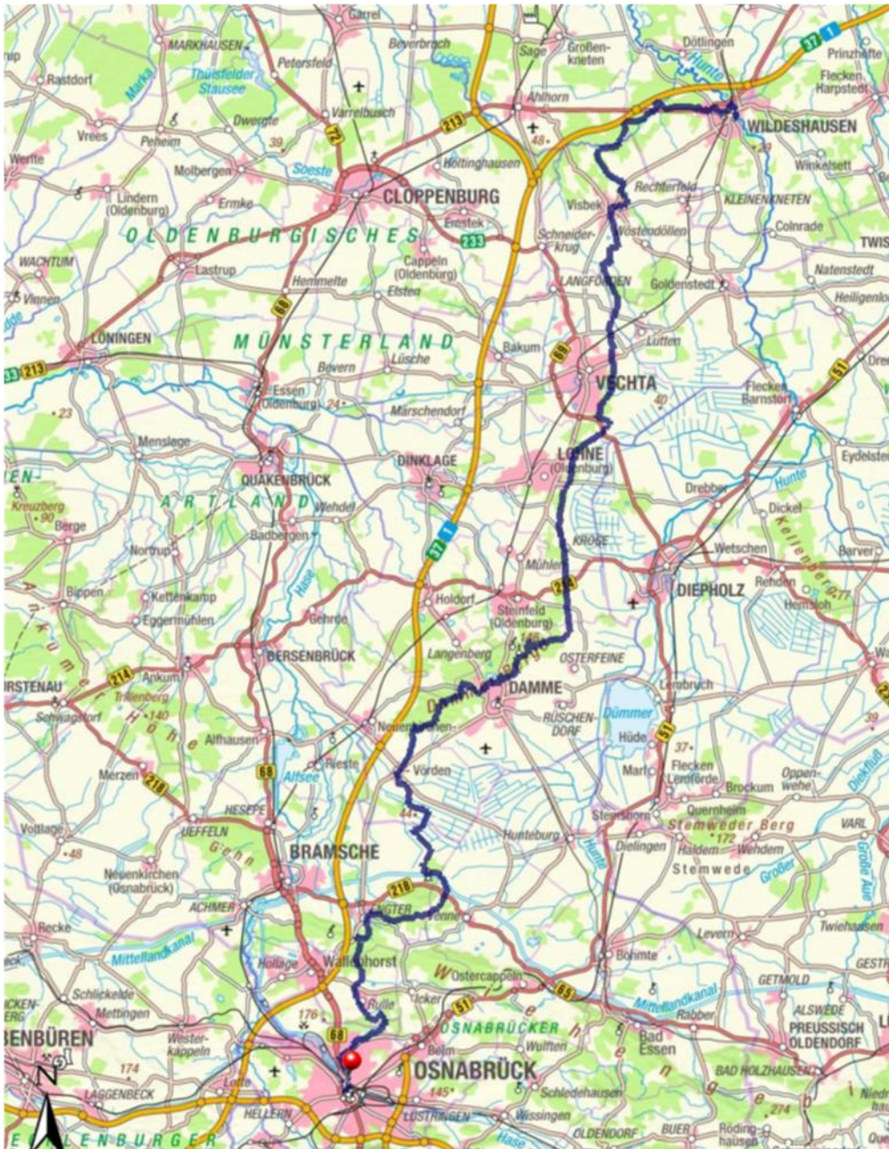
Pickerweg auf www.geolife.de

Kontakt: Wiehengebirgsverband Weser-Ems e.V. Rolandsmauer 23a 49074 Osnabrück Telefon 0541/29771 Fax 0541/201618 e-mail: wgv-weser-ems@t-online.de homepage: www.wgv-weser-ems.de