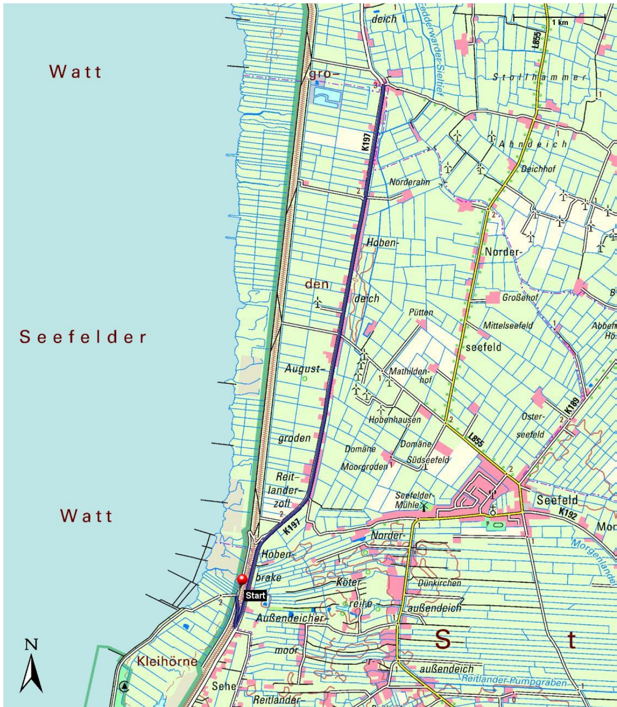
Umleitung während der Deichbauarbeiten. Kartengrundlage: geolife.de

Hier wird das Gebiet der Gemeinde Stadland erreicht, die K197 heißt hier „Augustgroden“. In einer Linkskurve wird die Gemeinde Butjadingen erreicht. Hier wird wieder die Normalroute erreicht. Wer der K197 (jetzt „Stollhammer Deich“) noch ca. 200 m folgt, kommt zum nördlichen Sperrungs-Schild. Die ursprüngliche Trasse kommt vom Deich auf die „Stollhammer Straße“ zu. Es geht in die „Ahndeicher Straße“, die Richtung Osten und damit vom Jadebusen weg führt. Nach wenigen Metern informiert ein Infoschild über einen ehemaligen